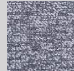
801 - Fiber 8 Bouclé